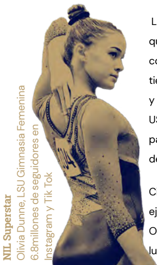
NIL Superstar Olivia Dunne, LSU Gimnasia Femenina 6.8 millones de seguidores en Instagram y Tik Tok